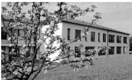
ZŠ a MŠ Všehovice

Od 1. ledna 2013 došlo ke změně zákona č. 561/2004 Sb. (školský zákon), kdy v návaznosti na nový zákon o rozpočtovém určení daní již není povinností obce, jejichž žáci navštěvují základní školu v jiné obci, přispívat na neinvestiční výdaje a provoz školy vyjma obcí, která mají zřízení společný školský obvod. A to z toho důvodu, že zřizovatel školy, bude podle nového rozpočtového určení daní (RUD) dostávat částku ze sdílených daní na všechny žáky