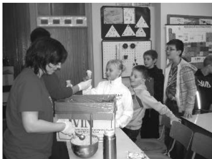
Chemie - výroba zmrzliny