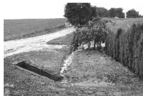
Propustek před opravou

To není poslední akce, kterou v rámci protipovodňových opatření realizuje. Jsme zapojeni do dvou společných projektů, které se tomuto tématu věnují. Prvním z nich projekt, který realizuje město Hranice a přizvalo ke spolupráci další obce správního obvodu Hranice. Jedná o projekt, jehož výstupem je vytvoření digitálního povodňového plánu, umístění srážkoměrů a hlásičů. Další projekt realizuje mikroregion Hranicko, který se zabývá vytvořením studie na realizaci přírodně blízkých protipovodňových opatření. Jedná se o opatření na ploše a opatření na tocích. Naše území stejně jako území dalších zapojených obcí bylo zmapováno a navrženo několik opatření na ploše, kde hrozí eroze půdy. Jsou to různé remízy, travnaté pásy - prostě taková opatření,