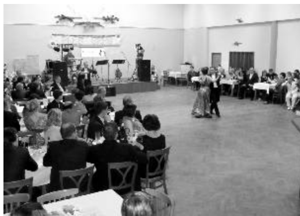
Ples SRPŠ 2013

SRPŠ přispívá na lyžařské kurzy žákům 4., 5. a 7. ročníku, na plavání žákům 2. a 3. ročníku, přispívá na dopravu na žakovské exkurze, na odměny pro žáky za dobrou reprezentaci školy, odměny za vynikající prospěch, cestovné na soutěže, knihy a věcné odměny pro žáky 9. ročníku, příspěvek na práci zájmových kroužků, drobné odměny za soutěže pořádané na Dětský den, na Mikuláše, na celoroční akce pořádané žáky 9. ročníku pro ostatní třídy.