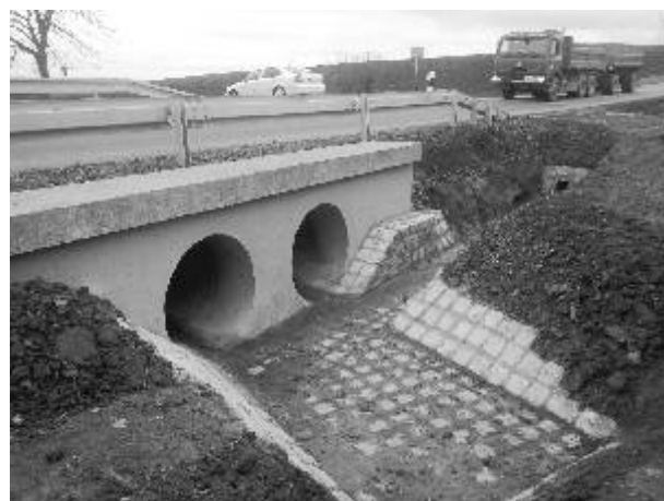
Propustek po opravě